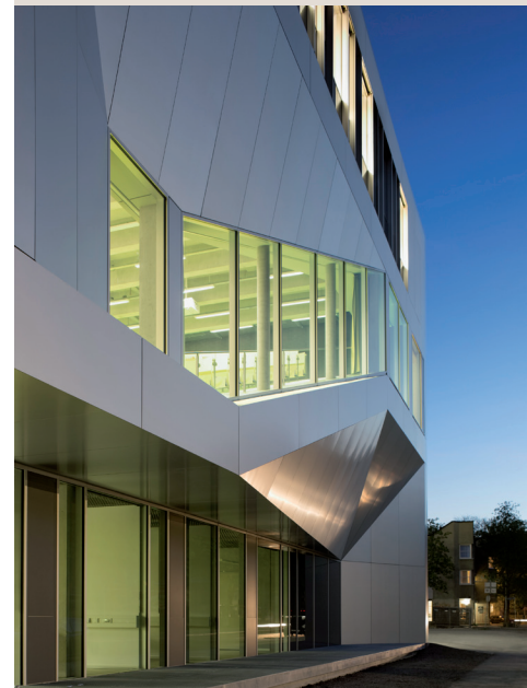
Abb. 2: Preisträger des Deutschen Fassadenpreises für vorgehängte hinterlüftete Fassaden (VHF) 2015, raumzeit Architekten (Berlin) mit dem Hörsaal Campus Center der Universität Kassel