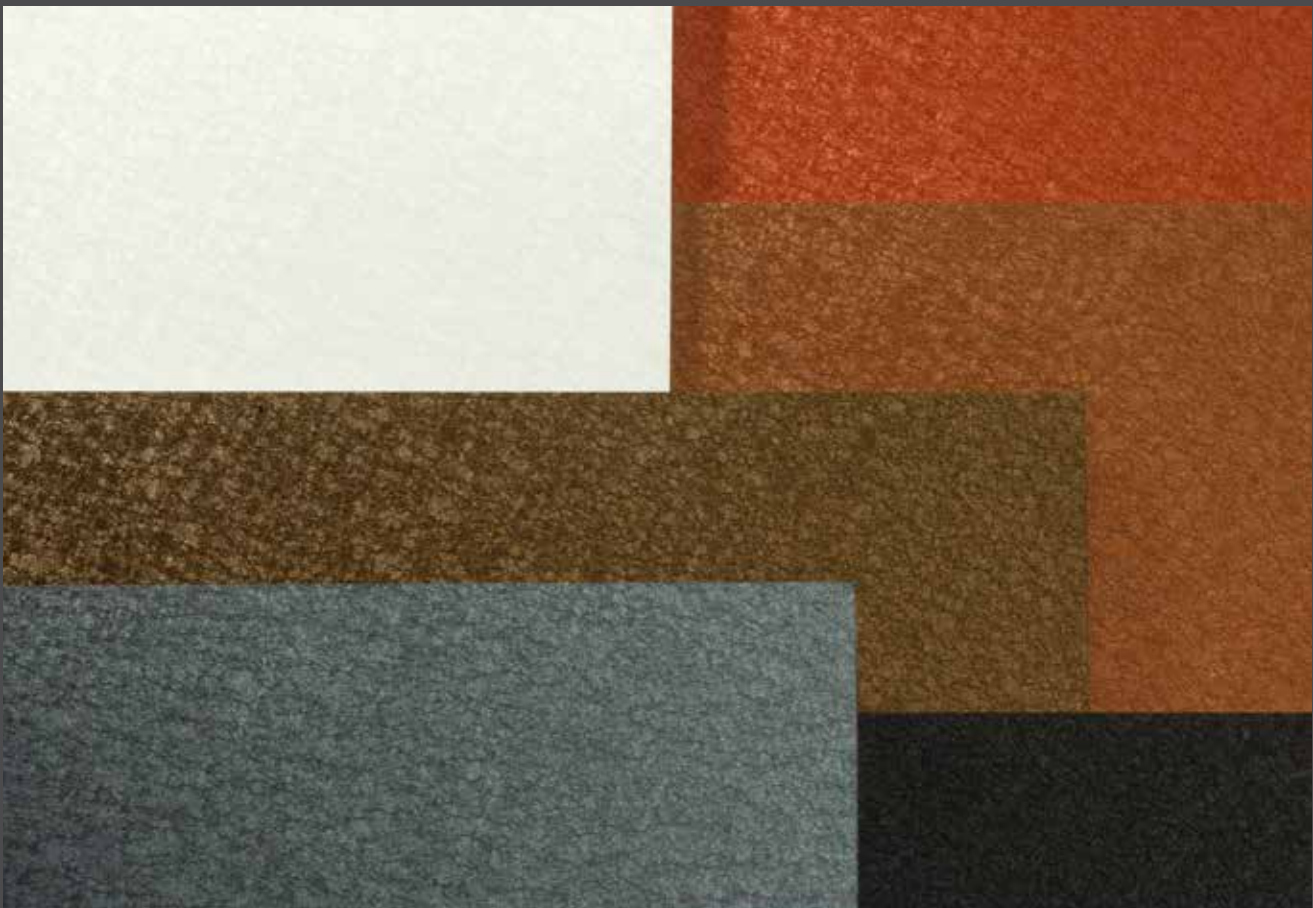
Characteristic of ALUCOBOND® terra is the crystalline matt sheen of the surface which changes with the light. | Charakteristisch für ALUCOBOND® terra ist die kristalline Oberfläche, deren Farbigkeit mit dem Lichteinfall matt changiert.

Beständigkeit, Ursprünglichkeit und Wertigkeit, dafür stehen Steine und Kristalle. Sie zaubern lebendige Lichtreflexe und überraschen mit unterschiedlicher Haptik von rau bis glatt. ALUCOBOND® terra ist inspiriert vom Schillern der Gesteine. Die Oberflächen der Dekore brechen das Tageslicht mit mattem Schimmer und zaubern so mal eine elegante, mal eine erdig changierende Farbigkeit. ALUCOBOND® terra verbindet die für Steinplatten typische, kristalline Oberfläche und samtige Haptik mit vielen Vorteilen der ALUCOBOND®-Verbundplatten: Anders als die meisten Natursteinplatten sind ALUCOBOND®-Verbundplatten sehr dünn und leicht, haben aber gleichzeitig eine hohe Biegesteifigkeit sowie Bruchfestigkeit. Große Plattenformate lassen sich einfach und passgenau herstellen, bearbeiten, transportieren, montieren sowie durch Abkanten und Rundbiegen mehrdimensional verformen. Dazu weist ALUCOBOND® terra, im Gegensatz zu vielen Steinoberflächen, eine sehr hohe Witterungs- und Farbbeständigkeit auf.